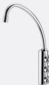
RUBINETTO - FAUCET

La Cristal Foss ha scelto la qualità dei raccordi ad innesto rapido di John Guest®