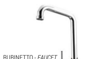
RUBINETTO - FAUCET Monocomando a 5 vie - canna alta Single-control Five-way mixer tap - high cane