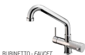
RUBINETTO - FAUCET Monocomando a 5 vie - canna bassa Single-control Five-way mixer tap - low cane