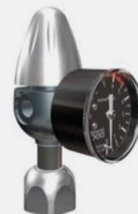
Riduttore per bombole ricaricabili con manometro di bassa pressione assiale Riducer for rechargeable gas cylinders with axial low pressure gauge