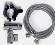
Kit di installazione Installation Kit